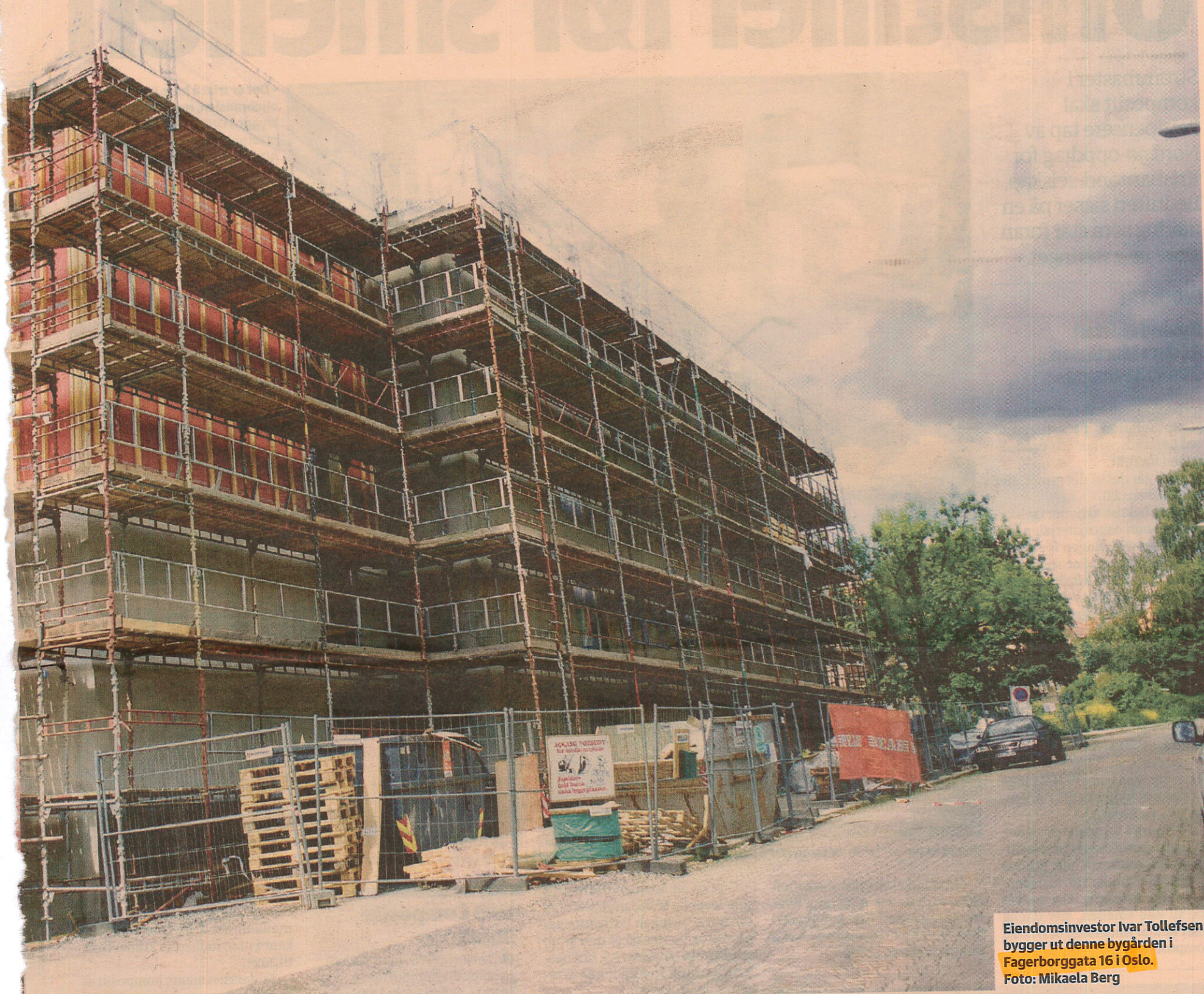
Eiendomsinvestor Ivar Tollefsen bygger ut denne bygården i Fagerborggata 16 i Oslo.